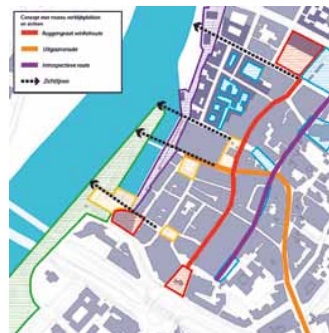
De fijnmazige structuur van de binnenstad is door nieuwe winkelstraten doorgetrokken tot de havenkade.

daarachter de rivier met zijn omzingen die je blik de stad uit leidt. Aan beide kanten van de haven wordt met niveaus gespeeld om een natuurlijke aansluiting te vinden op de hoger gelegen binnenstad. Over de haven ligt een ranke brug die beide delen met elkaar verbindt.