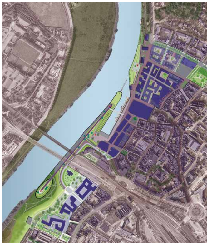
Het stedenbouwkundig plan voor de herontwikkeling van de Venlose binnenstad door Jo Coenen en Buro Lubbers.