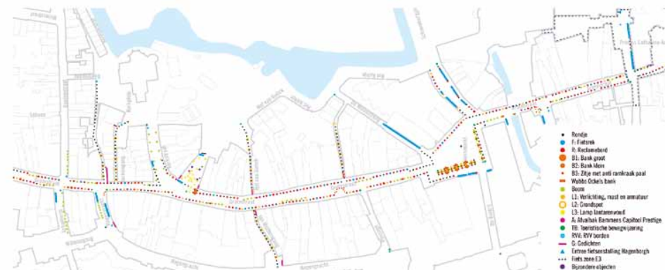
Voorstel van Artgineering voor de opknappbeurt van de Grotestraat, de ruggengraat van de Almeloese binnenstad. Maar er is meer nodig:

een overkoepelend idee waarin ondernemers, ontwerpers en andere belanghebbenden nadenken over waar welke winkels geconcentreerd