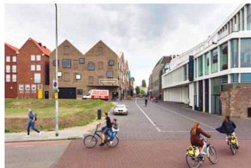
Ten noorden van de Maasboulevard heeft cultuur een prominente plek gekregen, onder meer met de uitbreiding van theater Maaspoort