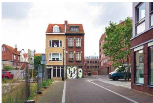
In het binnenstedelijke woongebied Q4 was voorheen veel vastgoed in handen van dubieuze eigenaren.