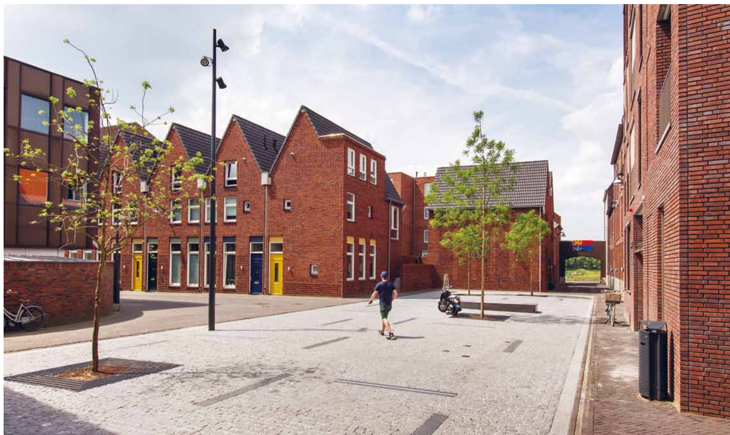
Fotograaf Daniel Nicolas ging terug naar zijn geboorteplaats Venlo en zag hoe de stad aan de Maas zijn verweerde binnenstad van nieuw elan voorziet. Het Synagogeplein in het kleinschalige woongebied Q4 – 'uit de details spreekt liefde voor de stad'.

Met het verbreden van de functie van de binnenstad van winkel- naar verblijfsplek liep Venlo voor de muziek uit