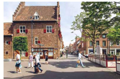
Hier zicht op de heringerichte Jodenstraat in het historisch centrum.