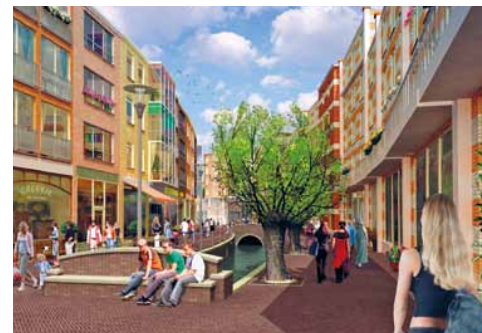
Impressies van het door Soeters Van Eldonk (tegenwoordig CommonAffairs) ontworpen nieuwe stadsdeel Brouwerspoort in Veenendaal.

Lange tijd lag Venlo met zijn rug naar de rivier. Het havenfront, dat tevens overlooppgebied is, was een desolate parkeervlakte geworden. Een verweerde plek, ideaal voor louche activiteiten. Een aantal grootschalige ingrepen bracht verandering. De fijnmazige structuur van de binnenstad werd door middel van nieuwe winkelstraten doorgetrokken tot de havenkade, er werden woningen toegevoegd, rond de haven werd hoogwaardige openbare ruimte