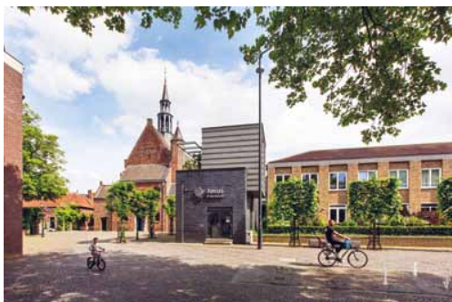
In het Kloosterkwartier – waar ook de Keizerstraat ligt – zijn woningen en culturele functies toegevoegd.