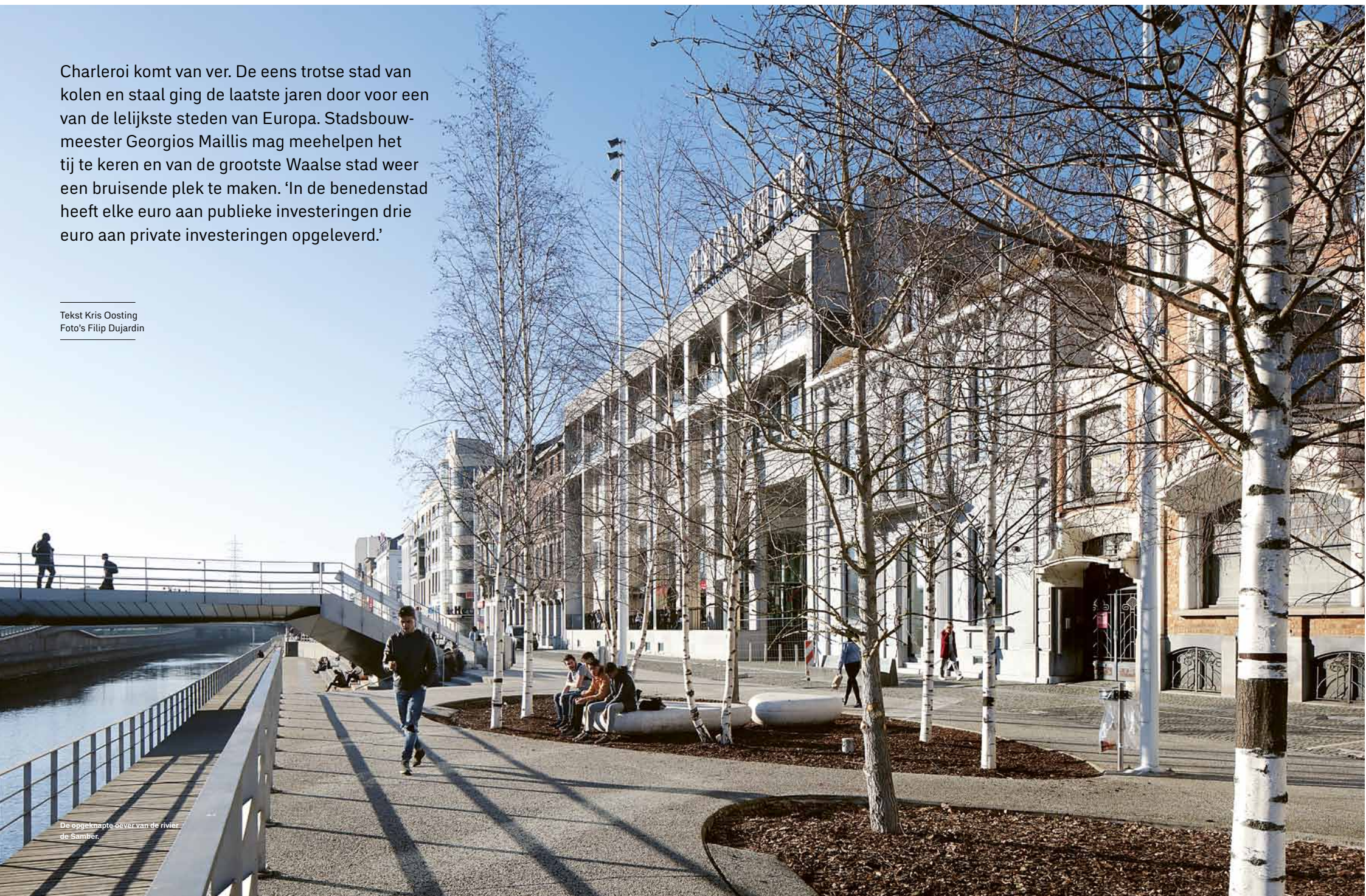
De opgeknapt oever van de rivier de Sambre.

Tekst Kris Oosting