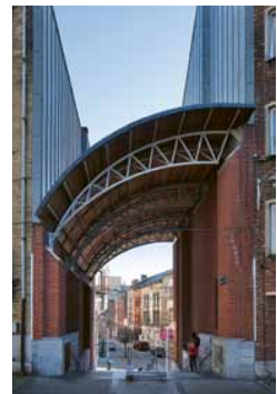
De indrukwekkende gebouwen van het ensemble Université du Travail. Het idee is om hier een studentencampus te stichten. In het Solvay-gebouw huist al de expositieruimte BPS22.