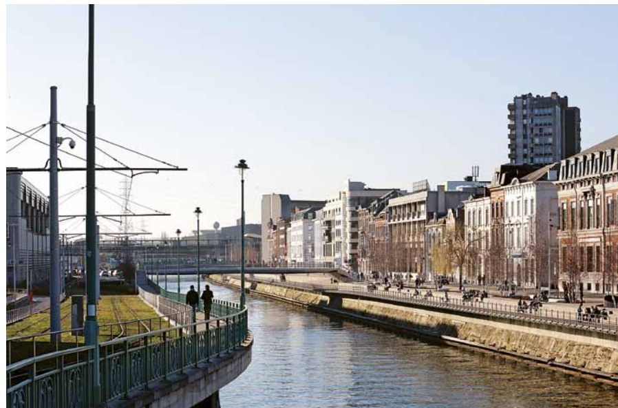
De inzet is dat Charleroi langs de Samber opleeft.

Die nieuwe stad ontkiemt voorzichtig langs de oevers van de Samber. Ter hoogte van station Charleroi Sud, de voornaamste entree tot de binnenstad, zijn de kades van de rivier getransformeerd. Verlaagde houten loopbruggen trekken het water bij de stad en op straatniveau hebben parkeerplekken plaatsgemaakt voor een lichtgrijze bestrating met bankjes en groen. Geen uitbundige transformatie, wel een effectieve. Bovendien is er nieuw leven ontstaan langs de kade. Panden werden opgeknapt, cultureel centrum en filmhuis Quai 10 vestigde zich er, evenals La Manufacture Urbaine – een restaurant, café en bierbrouwerij ineen. ‘Een paar jaar geleden leek het hier wel Sarajevo’, zegt Maillis met gevoel voor dramatiek, wanneer we door het centrum lopen. We komen van ver, wil hij maar zeggen. De trotse stad van kolen en staal werd de afgelopen decennia vernederd, raakte alles kwijt wat hem groot had gemaakt. De mijnen werden gesloten, de fabrieken raakten in onbruik. Werkloosheid, criminaliteit, alcoholisme en verloedering vielen de stad ten deel. Junkies en prostituees waren een vast onderdeel van het straatbeeld. De stad verloor maar liefst veertigduizend inwoners. Wat restte was een landschap van