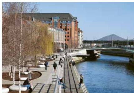
Ter hoogte van station Charleroi Sud zijn de kades van de rivier heringericht. Verlaagde houten loopbruggen maken het water weer aantrekkelijk. De straat kreeg een lichtgrijze bestrating, bankjes en berkenbomen.

‘We spelen met het idee van lelijkste stad. Ik vind het geweldig, op dat imago bouwen we door’