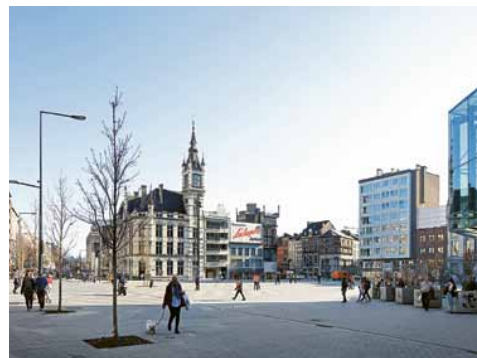
Het winkelcentrum staat aan Place Verte dat is heringericht tot modern stadsplein.