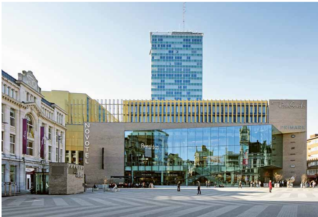
Als een ruimteschip in de stad geland, maar toch een motor voor vernieuwing: het vaalrode winkelcentrum Rive Gauche.