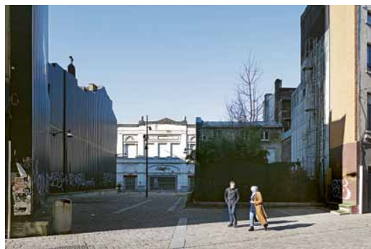
Rondom Rive Gauche en Place Verte toont het oude Charleroi zich. Versleten en lege panden bepalen het straatbeeld.

steenafvalbergen en verlaten industrie. Le pays noir , het zwarte land, kleurde langzaam roestbruin.